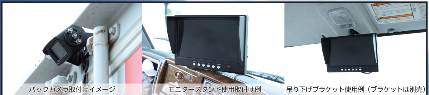
バックカメラ取付けイメージ