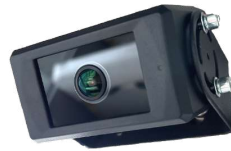
AI搭載人物検知カメラ