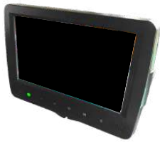
車内確認4分割モニター