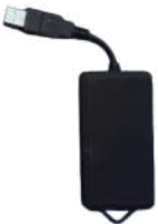
キャリブレーションユニット