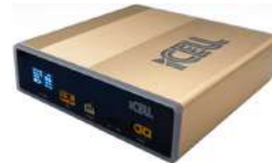
リン酸鉄リチウムバッテリー